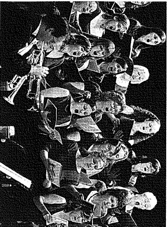
Hi van participar les corals Belles Arts i Nova Ègara