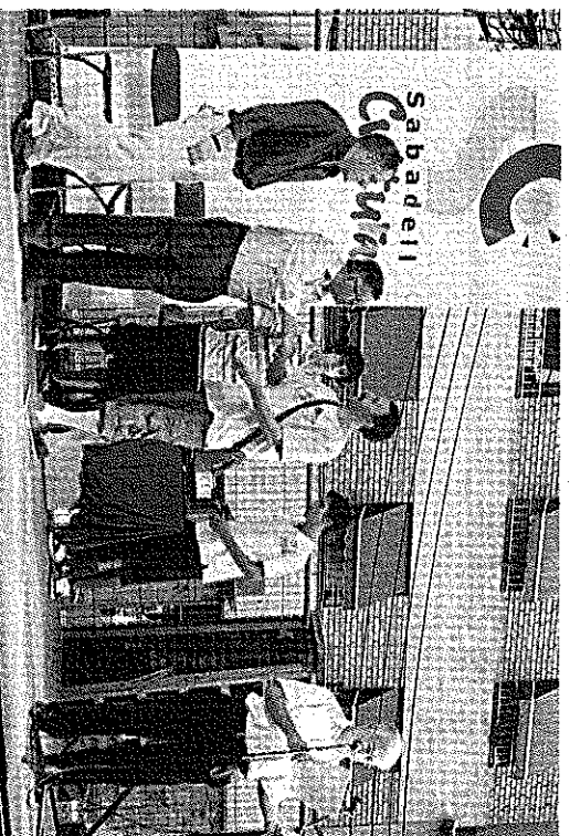
Es van lliurar plaques de record a entitats i col·laboradors