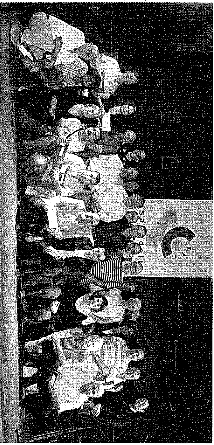
Fotografia de família dels representants de les entitats de la Federació, les convidades i els premiats